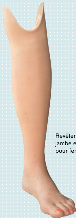
Revêtement de jambe esthétique pour femme