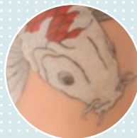
Tatouage Possible sur demande