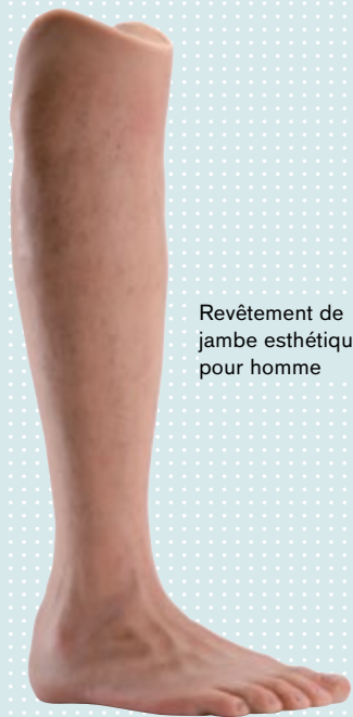
Revêtement de jambe esthétique pour homme