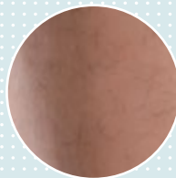
Pilosité Parfaitement harmonisée avec la jambe controlatérale